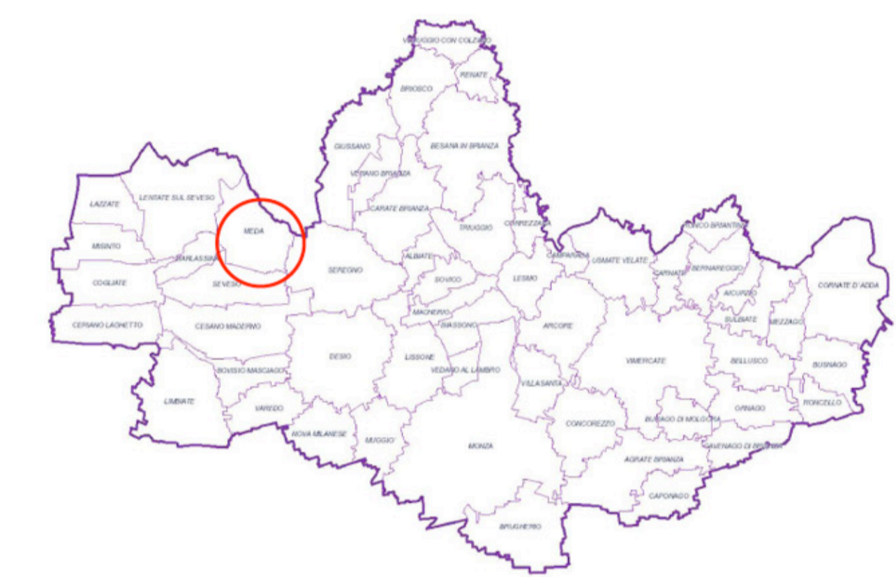
PTCP Monza e Brianza - confini comunali e provinciali